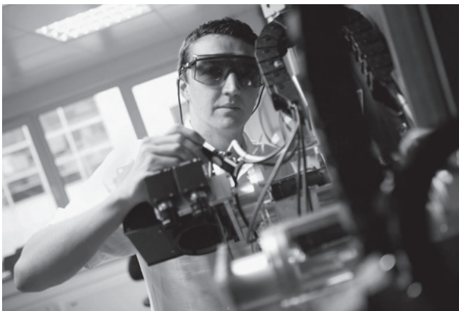
Die Optischen Technologien benötigen nach BMBF-Hochrechnungen rd. 1 400 Jungakademiker mit fachspezifischer Ausbildung pro Jahr.

Gleichwohl sind gegenwärtig noch institutionelle Faktoren wirksam, die die Unternehmen zögern lassen. So haben beispielsweise einzelne Unternehmen substanzielle Mittel angeboten, ohne dass zeitnah geeignete Bewerber gewonnen werden konnten. Außerdem sind Mitglieder der Arbeitsgemeinschaft Laser bereits im Rahmen der Finanzierung von Masterstudiengängen aktiv. Wegen mangelnder Praktikantenplätze hat sich jedoch kein optimaler Erfolg einstellen können.